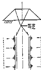
図 3 - 1 耳芝